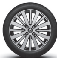
16-Zoll-Leichtmetallrad „Monega“, glanzgedreht mit Schwarz RDIF54