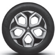
15-Zoll-Stahlrad mit Radabdeckung „Vegas“, glanzgedreht mit Schwarz RDIF08