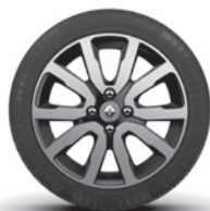
15-Zoll-Leichtmetallrad „Altana“, glanzgedreht mit schwarz RDIF24