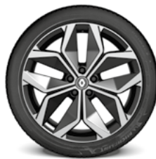
20-Zoll-Leichtmetallfelge diamantpoliert Schwarz Techno