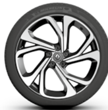
20-Zoll-Leichtmetallfelgen diamantpoliert Executive

● = Serie, ○ = Paketinhalt, - = nicht verfügbar