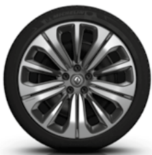
20-Zoll-Stahlfelgen mit bitonalem Design Equilibre